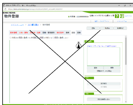
「画面上で図面を作成する」機能は廃止

新システムの図面登録方法は、「自社で作成された図面をアップロードする」のみとなり、現行システムの「画面上で図面を作成する」機能や「協会サイト連携時の図面自動生成」は廃止されます。